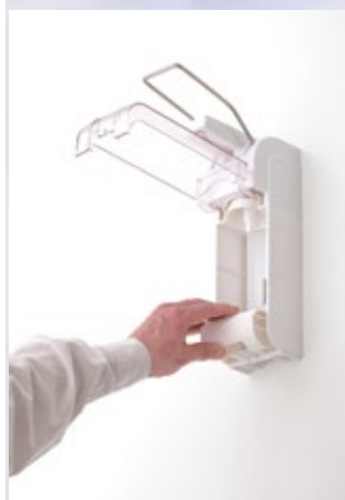
Inlegplaat voor de 500ml flacon