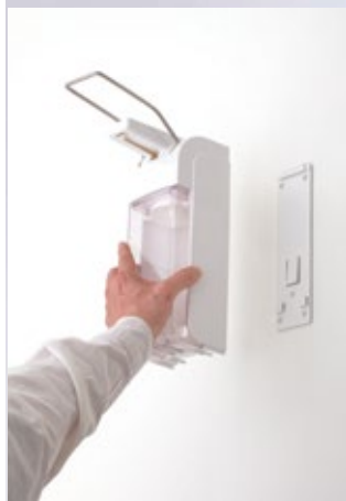
Dispenser met wandhouder, eenvoudige montage