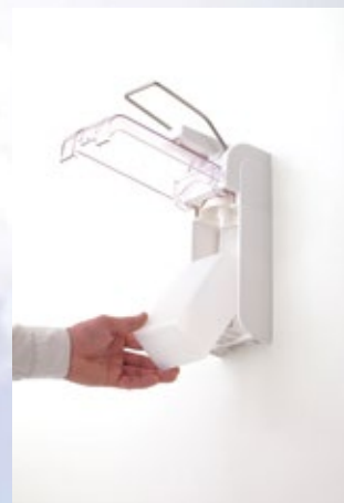
Inzetten van de 1000ml flacon