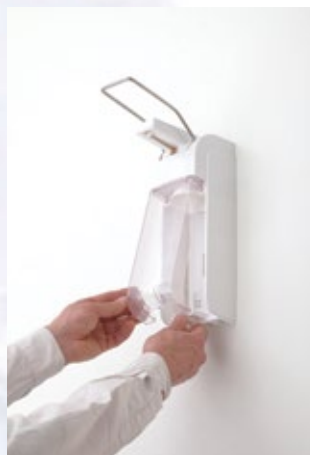
Dispenser met sluitplaat, afsluitbaar