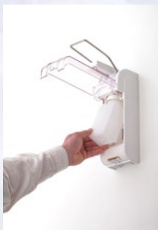
Inzetten van de 500 ml flacon