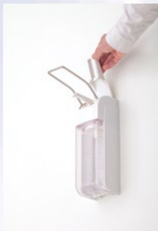
De bovenklep kan open om de pomp uit te nemen of de doseerhoeveelheid in te stellen