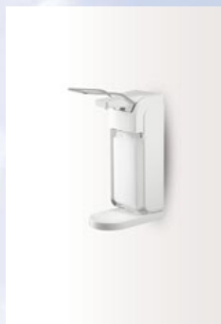
Klaar voor gebruik